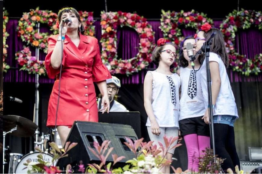
San Isidro Madrid

En definitiva, Un concierto de Music In Action es el complemento ideal para reforzar el aprendizaje del inglés en un contexto animado a la par que divertido y a su vez acercar la música en vivo a los niños.