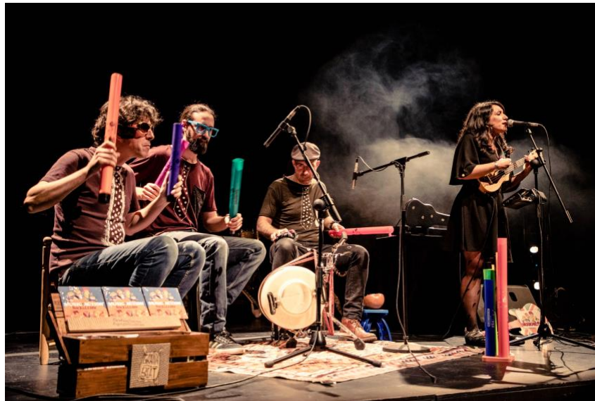
Tocando Boomwhackers en Auditorio Alcobendas

Además de tocar su concierto de Rock también incluyen un set con Boomwhackers (tubos de percusión melódica) con los que interpretan canciones actuales y algunas suyas.