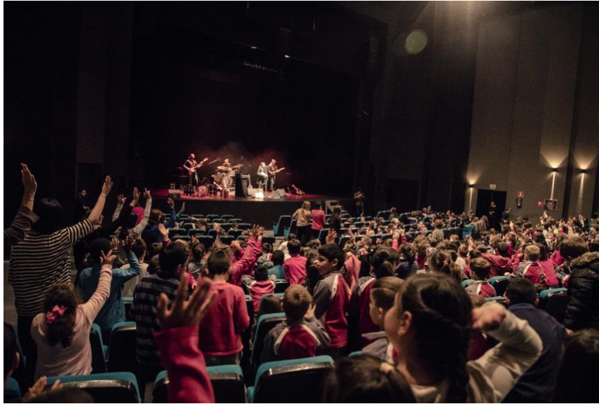
Campaña escolar Auditorio Alcobendas 2017