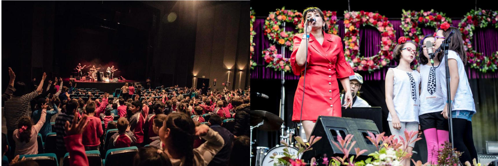
San Isidro Madrid 2018