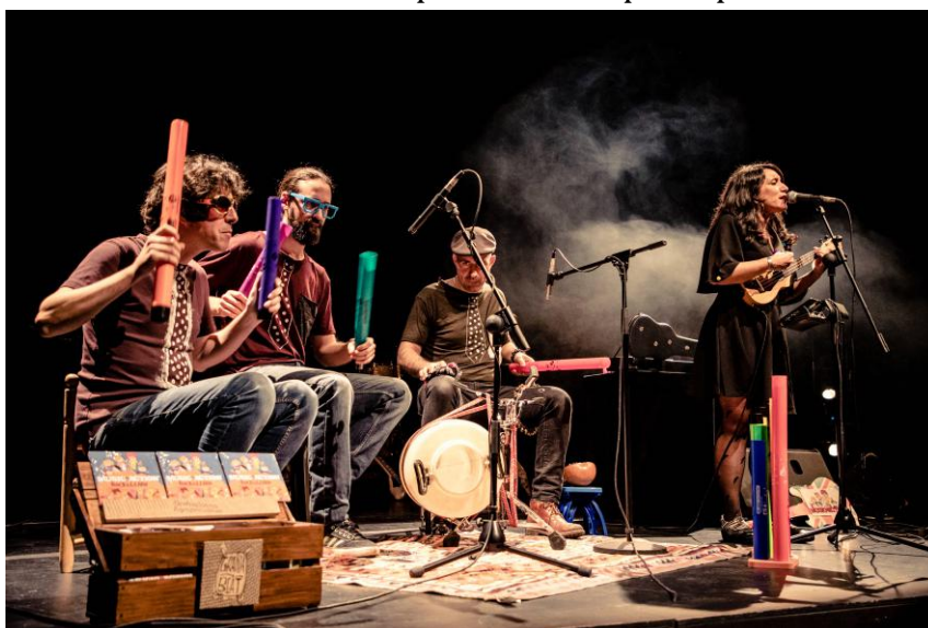
Tocando Boomwhackers en Auditorio Alcobendas

Music In Action también imparte talleres para aprender a tocar Boomwhackers en colegios (más info en web)