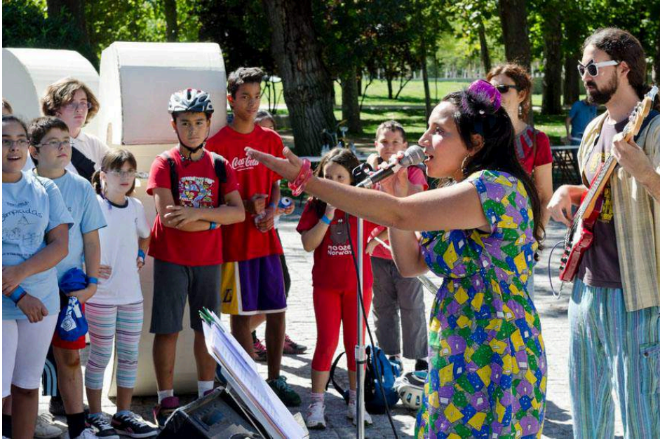
Music In Action en concierto en la campaña “Bike to school is cool” STARS (para fomentar el transporte en bici en Madrid) sept 2013

Todas las actividades se pueden hacer antes o después de escuchar la canción. El librito también incluye las letras que se pueden cantar con las versiones karaoke que incluye el CD.