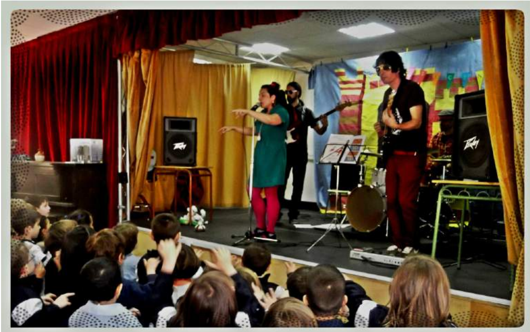
Colegio san Eugenio San Isidro Madrid Abril 2014

En definitiva, Un concierto de Music In Action es el complemento ideal para reforzar el aprendizaje del inglés en un contexto animado a la par que divertido y a su vez acercar la música en vivo con un concierto de Rock en Mayúsculas para los niños.