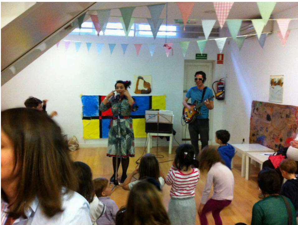
Music In Action en la noche de los libros en Librería Pepa Luna (Abril 2013)