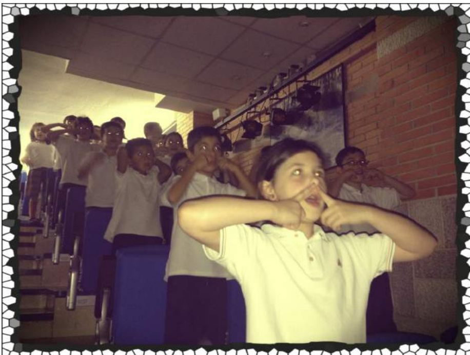
Alumnos del colegio Gredos San Diego Vallecas Abril 2014