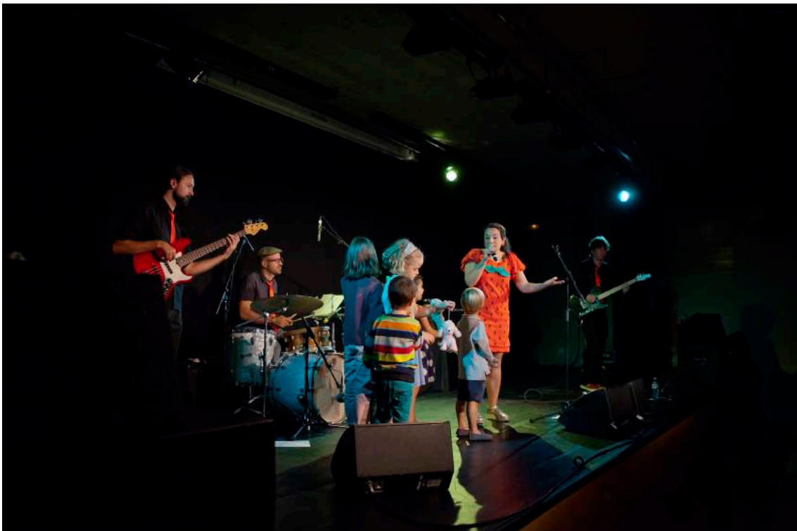
Music in action en La Casa Encendida ciclo “ La Caja de Música” Octubre 2015.