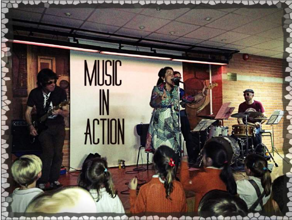
Music In Action en el Colegio Gredos San Diego Vallecas (Abril 2014)